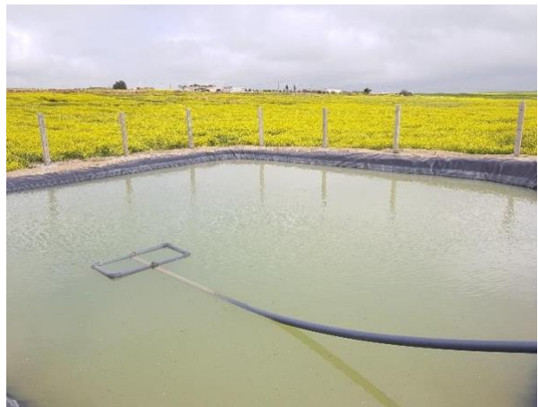
La réserve d'eau 400 m 3