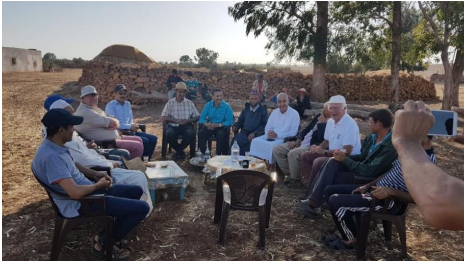
Première réunion avec les 20 familles bénéficiaires en juillet 2019

Nous attendons les devis concernant ce projet, la liste des adhérents ou bénéficiaires, un plan cadastral, les différentes autorisations marocaines, l'acte de cession des deux terrains au profit « des Oliviers Verts »