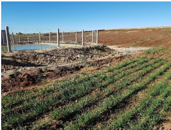
Les premiers potagers en 2018

Signature de la convention tripartite et remise de la lettre de don.